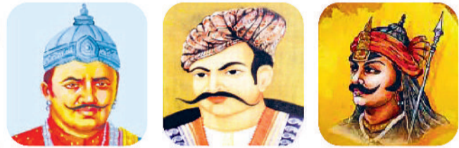
राजा नाहर सिंह राजा राव तुलाराम महाराणा प्रताप