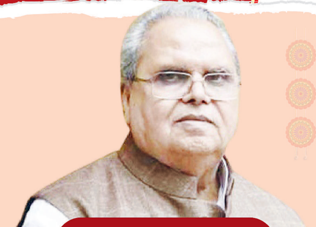
मुख्यातिथि माननीय श्री सत्य पाल सिंह मलिक प्रसिद्ध भारतीय राजनीतिज्ञ एवं पूर्व राज्यपाल- जम्मू कश्मीर, गोवा, बिहार एवं मेघालय