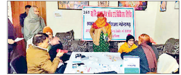
महेन्द्रगढ़। नेत्र रोगियों की जांच करते विशेषज्ञ।