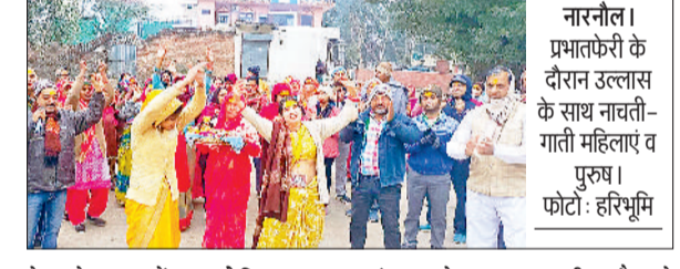
नारनौल। प्रभातफेरी के दौरान उल्लास के साथ नावती-गाती महिलाएं व पुरुष।