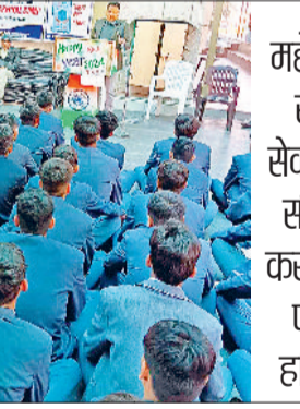
महेन्द्रगढ़। स्वयं-सेवकों को संबोधित करते हुए।