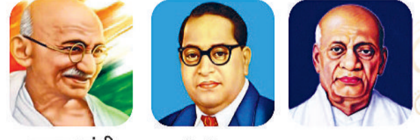
महात्मा गांधी डॉ. भीमराव अम्बेडकर सरदार वल्लभभाई पटेल

स्थान: नई अनाज मंडी, चरखी दादरी प्रीतिभोज : प्रातः 11:00 बजे से