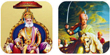
महाराज अग्रसेन रानी लक्ष्मीबाई