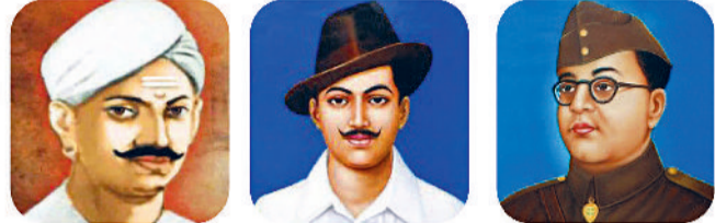
मंगलपाण्डे शहीद भगत सिंह सुभाष चन्द्र बोस