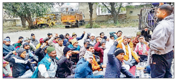
नारनौल। सब अर्बन एसडीओ बिजली निगम कार्यालय परिसर में बैठक करते कर्मचारी।

जाने की उम्मीद है। यह मेडिकल कॉलेज जिला महेन्द्रगढ़ का पहला मेडिकल कॉलेज होगा। इस कॉलेज के शुरू होने पर इलाके की स्वास्थ्य क्षेत्र में कायाकल्प होने की उम्मीद है। यहां पर न केवल सामान्य बीमारियों, अपितु जटिल असाध्य रोगों का उपचार भी संभव हो सकेगा।