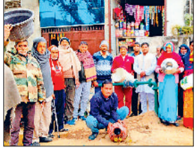
सतनाली मंडी। बोरेवेल के पास रोष प्रकट करते पेयजल समस्या से परेशान लोग।