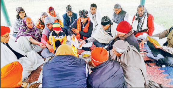
नारनौल। मासिक यज्ञ में भाग लेते हुडा सेक्टर के गणमान्य लोग।