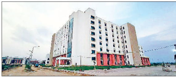
नारनौल। कोरियावास में निर्माणाधीन मेडिकल कॉलेज।

कोरियावास में बनाया जा रहे सरकारी अस्पताल एवं मेडिकल कॉलेज में पेयजल आपूर्ति के लिए सिंचाई एवं जल संसाधन विभाग नारनौल स्थित एनडी-2 पंप हाउस से मेडिकल कॉलेज तक पाइप लाइन दबाएगा। इसके जरिए मेडिकल कॉलेज परिसर में कच्चा नहरी पानी पहुंचाया जाएगा, जिसके लिए नहर विभाग ने चिकित्सा महाविद्यालय तक नहरी पानी आधारित पाइप लाइन का टेंडर आमंत्रित किया है। इसकी अनुमानित लागत करीब 736.5 लाख रुपये आएगी तथा इच्छुक आवेदकों या नि ठेकेदार को 11 जनवरी तक ऑनलाइन आवेदन करना होगा। बाद में जिस